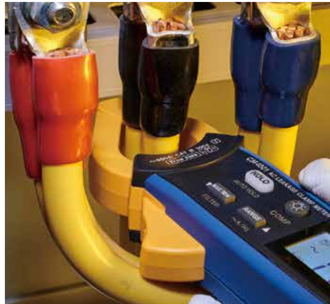
간격이 좁은 굵은 선과 더블배선도 손쉽게 클램핑