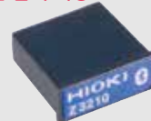
무선 어댑터 Z3210